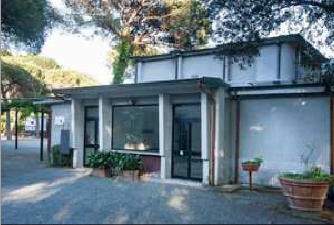
Fronte viale Italia x via Diaz